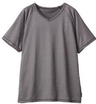
ラグランスリーブVネック 12,100円(税込)