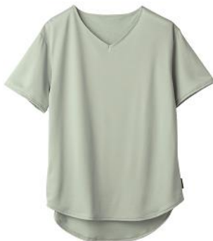
ショートスリーブ 12,100円(税込)