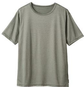
ショートスリーブ 12,100円(税込)