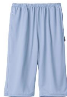
ひざ下パンツ 12,100円(税込)