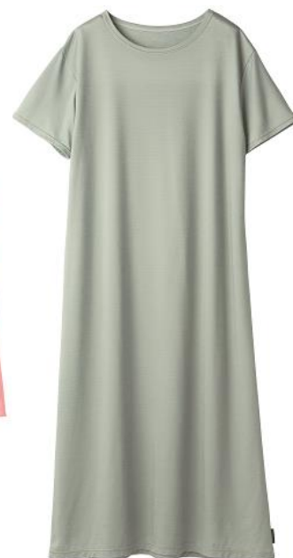
ワンピース 16,500円(税込)