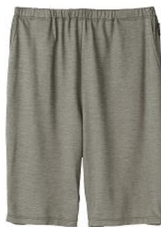
ハーフパンツ 12,100円(税込)