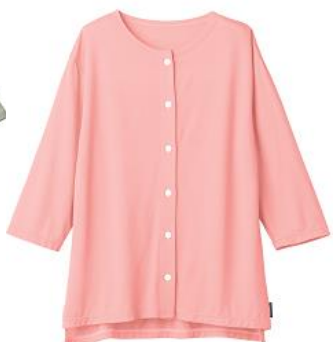
7分袖フロントオープン 14,300円(税込)