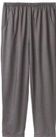
8分丈テーパードパンツ 14,300円(税込)