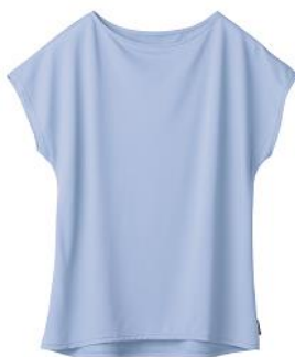
フレンチスリーブボートネック 11,000円(税込)