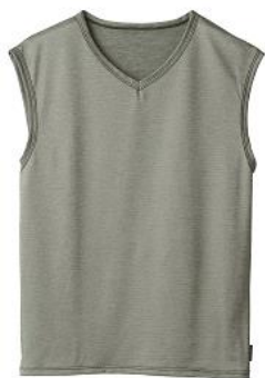
スリーブレスVネック 9,900円(税込)