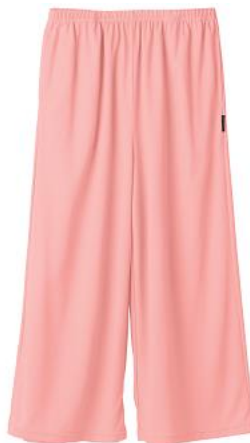
ガウチョパンツ 14,300円(税込)