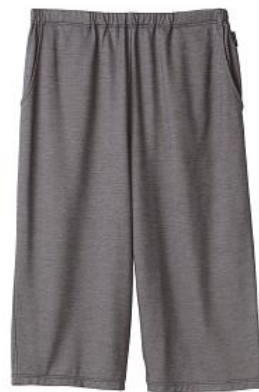
ひざ下丈パンツ 14,300円(税込)