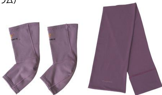
アンクルコンフォート（プラム）