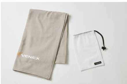
リカバリークロス（ベージュ or ブラック）

『ループネックカバー』：片側をループの仕様にし、着用時にほどけないデザインで日常に溶け込む首回りアイテムです。滑らかなセルロース素材で光沢があり、おうち時間の首元を華やかに見せます。（カラー：プラム）