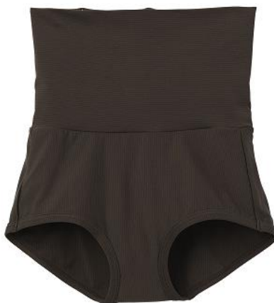
おうちインナー ゴムなしボディショーツ