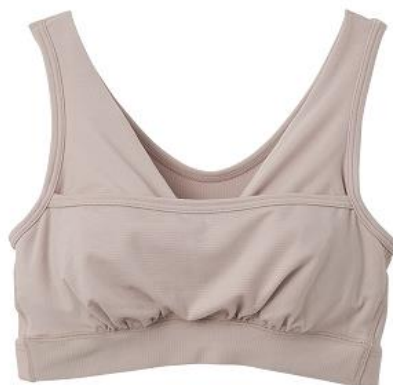
おうちインナー ギャザリングブラ (パッド付き)