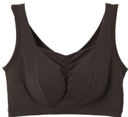
おうちインナー シャーリングブラ (パッド付き)