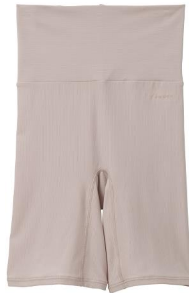
おうちインナー ゴムなしボディショーツ 4 分丈