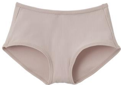
おうちインナー ゴムなしショーツ