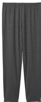
コンフォートダブル ロングセットアップメンズ 25,300 円