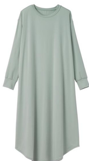
コンフォートダブル ワンピースレディース 20,900 円