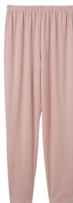
コンフォートダブル ロングセットアップレディース 25,300 円