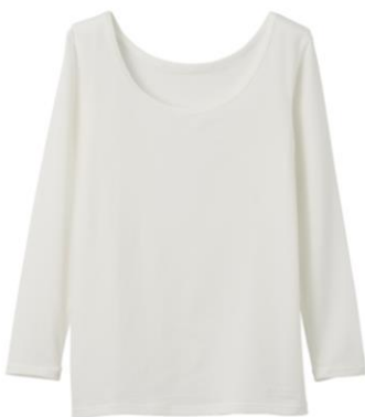
おうちインナー Uネック 9分袖 9,900 円