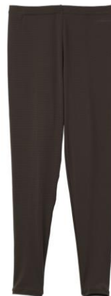
おうちインナー レギンス 9,900 円