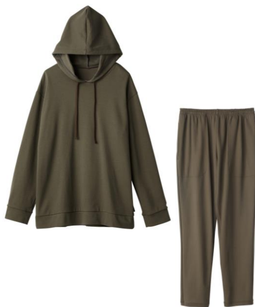
コンフォートポンチ フーディーセットアップ 23,100円