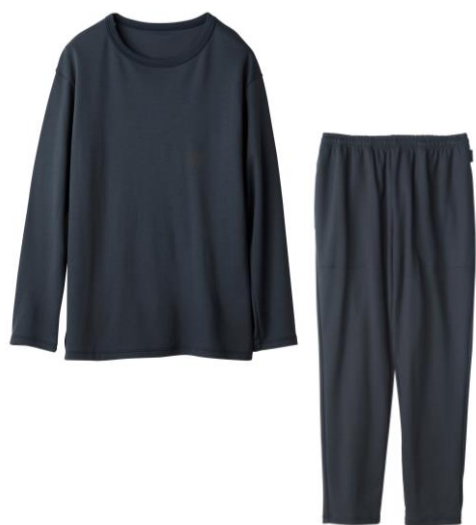
コンフォートポンチ ロングセットアップ 22,000円