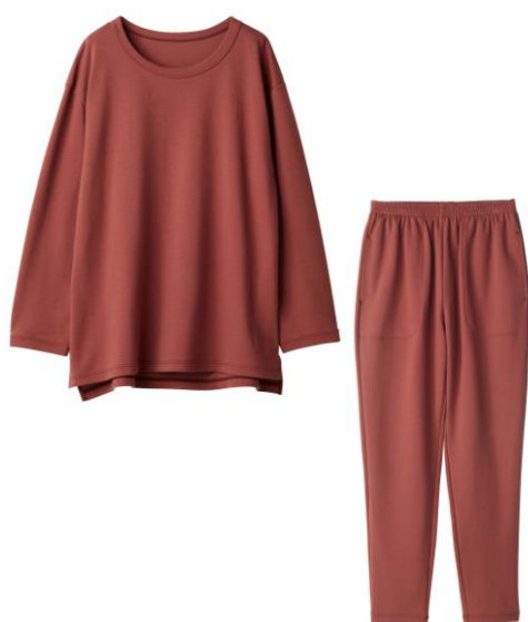
コンフォートポンチ ロングセットアップ 22,000円