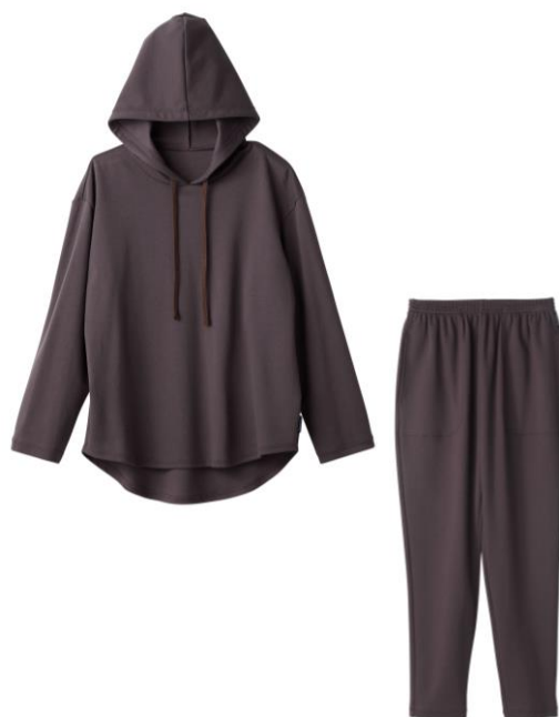
コンフォートポンチ フーディーセットアップ 23,100円