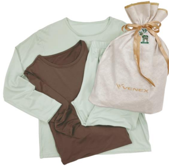
コンフォートダブル セットアップ メンズ & おうちインナー クルーネック 9分袖 メンズ 35,200 円