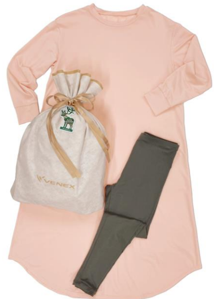
コンフォートダブル ワンピース レディース & おうちインナー レギンス レディース 30,800 円