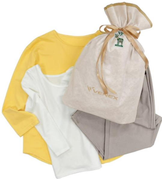
コンフォートダブル セットアップ レディース & おうちインナー Uネック 9分袖 レディース 35,200 円