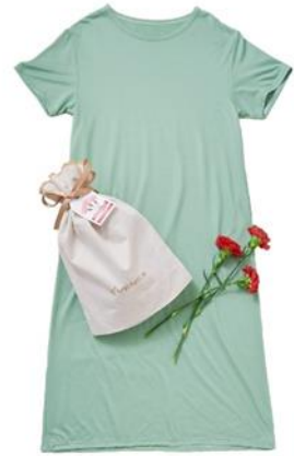
母の日スペシャルギフトセット コンフォートクール ワンピース