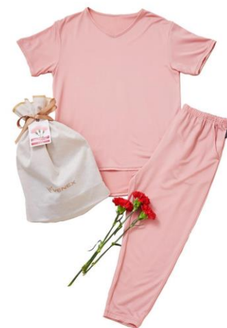
※カーネーションはセットに含まれません。