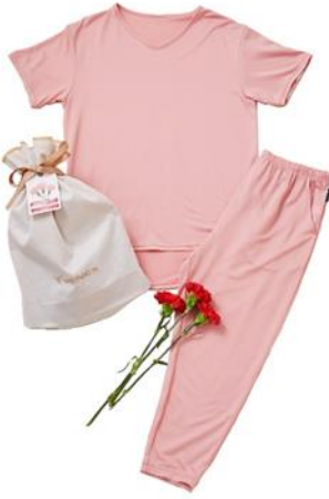
母の日スペシャルギフトセット コンフォートクール 半袖＋ 8分丈テーパードパンツ 上下セット