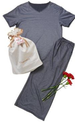
母の日スペシャルギフトセット コンフォートクール 半袖＋ ガウチョパンツ 上下セット