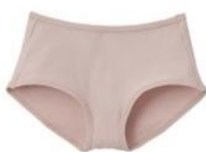
ゴムなしショーツ ¥3,520 (税込)