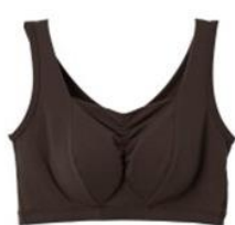
シャーリングブラ(パッド付き) ¥6,820 (税込)

当社ブースにご来場いただいた方の限定特典として、VENEX 公式オンラインストアで対象商品『おうちインナー』シリーズの 5 アイテムの購入時にお使いいただける 10%OFF クーポンを配布します。(有効期間：5月25日(水)～6月12日(日))