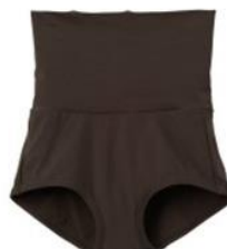
ゴムなしボディショーツ ¥6,380 (税込)