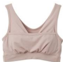
ギャザリングブラ(パッド付き) ¥7,480 (税込)