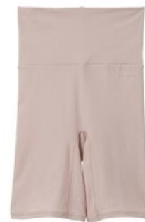
ゴムなしボディショーツ 4分丈 ¥7,480 (税込)