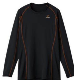
前モデル（2022年春夏シーズン）