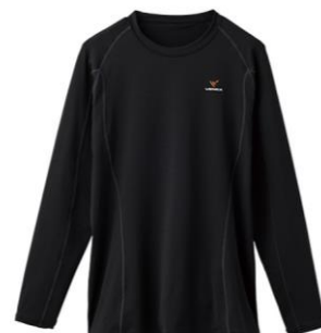
新モデル（2022年秋冬シーズン）