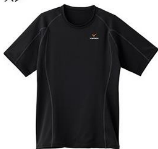
ショートスリーブ ¥9,900