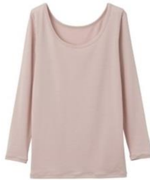
Uネック 9分袖 ¥9,900