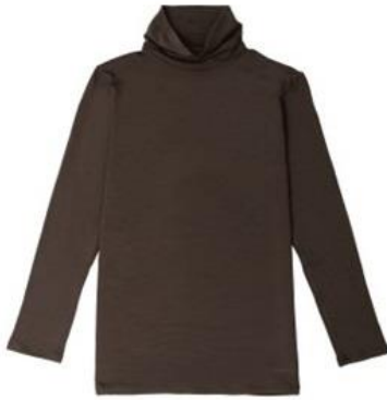
タートルネック 9分袖 ¥11,000