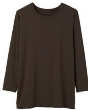
クルーネック 9分袖 ¥9,900