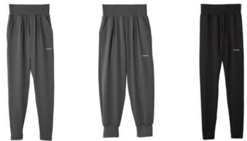
ロングテーパーパードパンツ 14,300円 (税込) 8分丈ジョガーパンツ 14,300円 (税込) レギンス 13,200円 (税込)