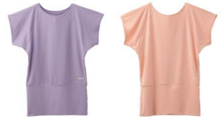
バックオープンTシャツ 13,200円 (税込)