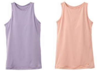
カップ付きタンクトップ 13,200円 (税込)