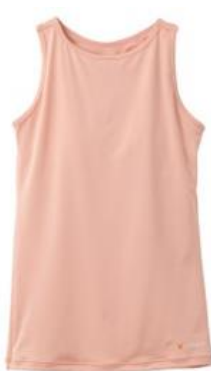
カップ付きタンクトップ 13,200円（税込）