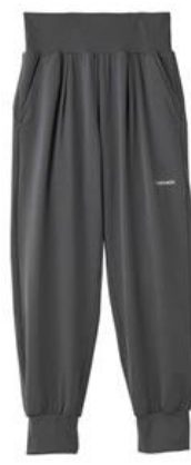
8分丈ジョガーパンツ 14,300円（税込）