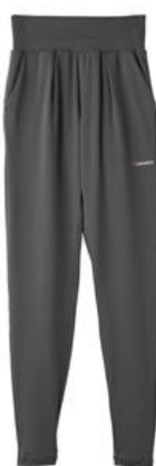
ロングテーパーパンツ 14,300円（税込）