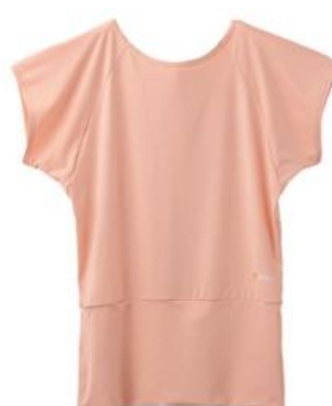
バックオープンTシャツ 13,200円（税込）