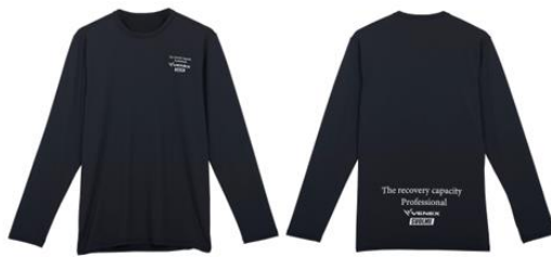
リカバリーロングTシャツ 12,100円(税込)