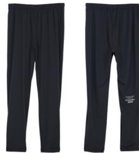
リカバリーロングパンツ 12,100円(税込)