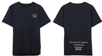
リカバリーTシャツ 9,900円(税込)